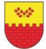
Občina Miren Kostanjevica

L'evento è stato organizzato dal Centro Informazioni Turistiche TIC di Nova Gorica in collaborazione con la Comunità Locale di Grgarske Ravne.