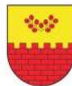
Občina Miren Kostanjevica